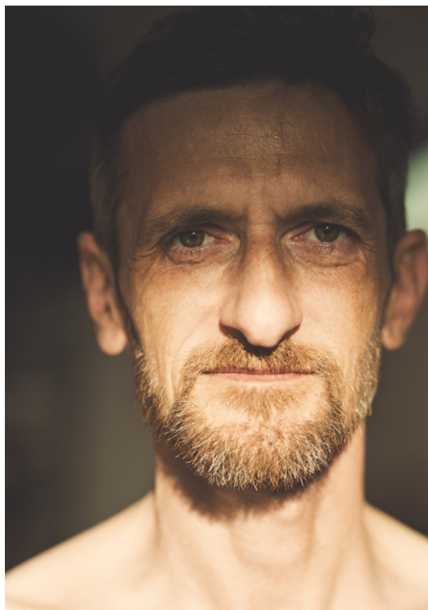
Availabe Light, 85 mm, f 2.5, 1/200, ISO 100