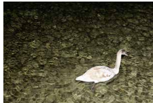
An der Schiffslände am Traunsee